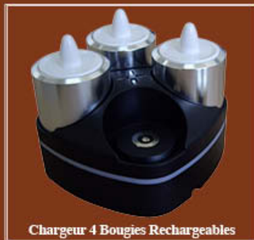
Chargeur 4 Bougies Rechargeables